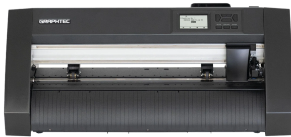
滾筒式 中型 CE8000-40