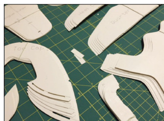
服裝打版／鞋業打樣